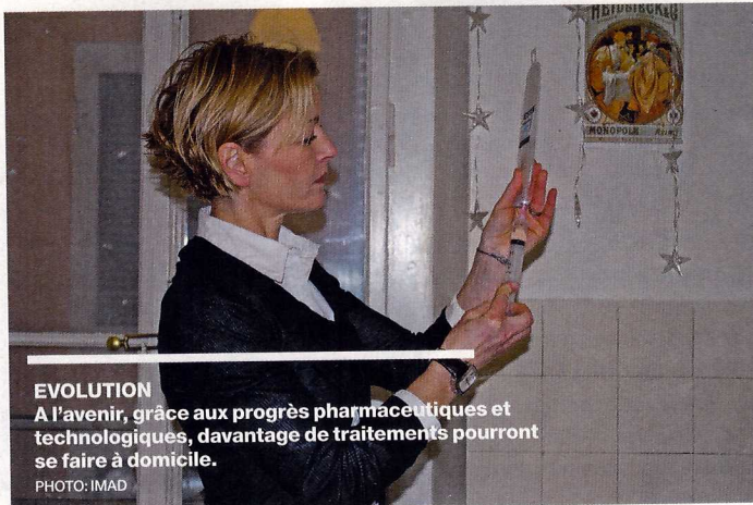
EVOLUTION A l'avenir, grâce aux progrès pharmaceutiques et technologiques, davantage de traitements pourront se faire à domicile.